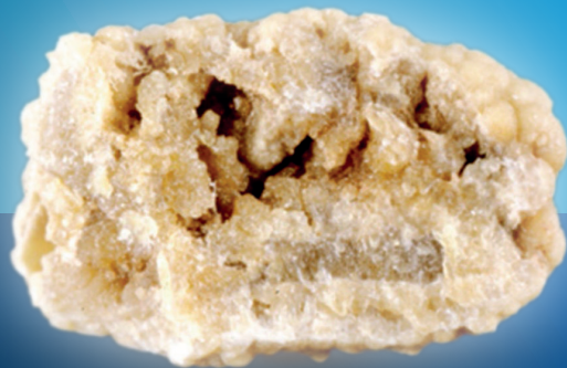
Immagine da Fig. 11, Cloutier 2015

Centralità dell'urologo nella diagnosi precoce di PH1 in pazienti con urolitiasi